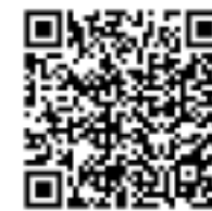
福岡県警察 ホームページ

（ヘルメット非着用の場合、着用時に比べ事故時の致死率が約4倍高まります。頭部を守る事が極めて重要です。）