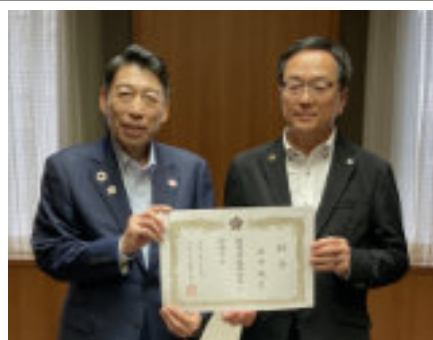
6/24服部知事より監査委員を任命

本県議会として、今後とも県民・市民の人権擁護、生活支援に積極的に取り組んで参ります。