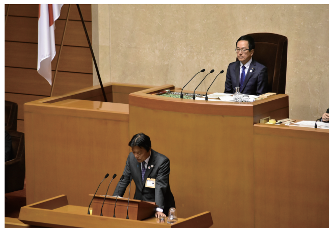
2020年3月『2月県議会』議長席