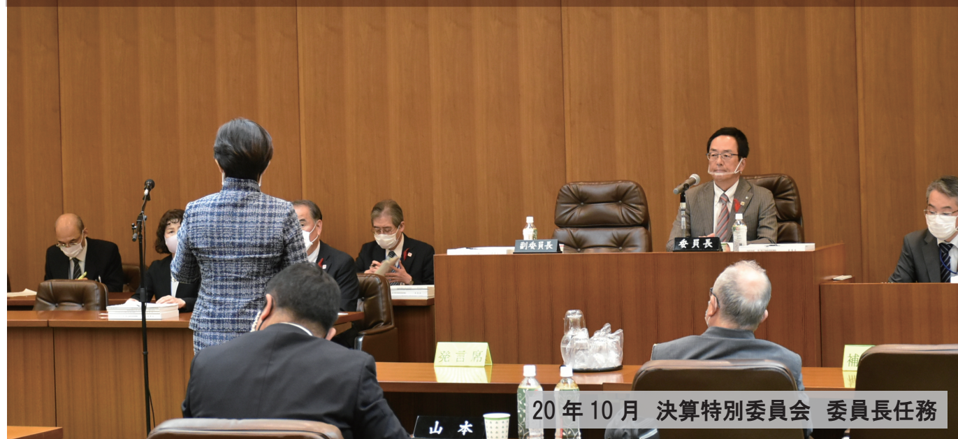
20年10月 決算特別委員会 委員長任務

コロナ感染症対策、豪雨災害対策をはじめ、 皆様の健康、福祉、安全、教育、生活、そして経済を守るため 県政の躍進に努めています！